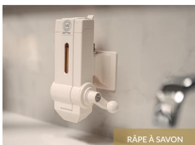
RÂPE À SAVON